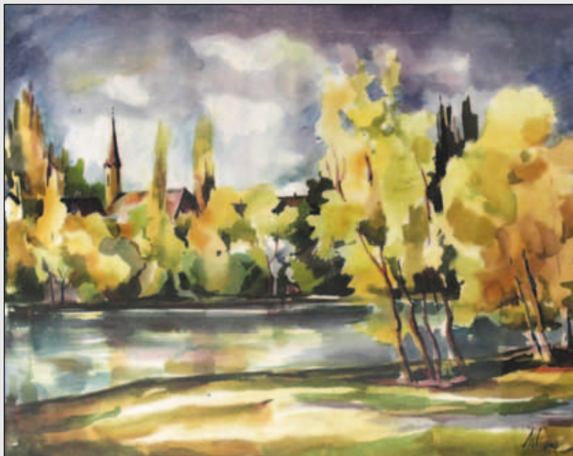
Molnár Irén: Bodrogpart