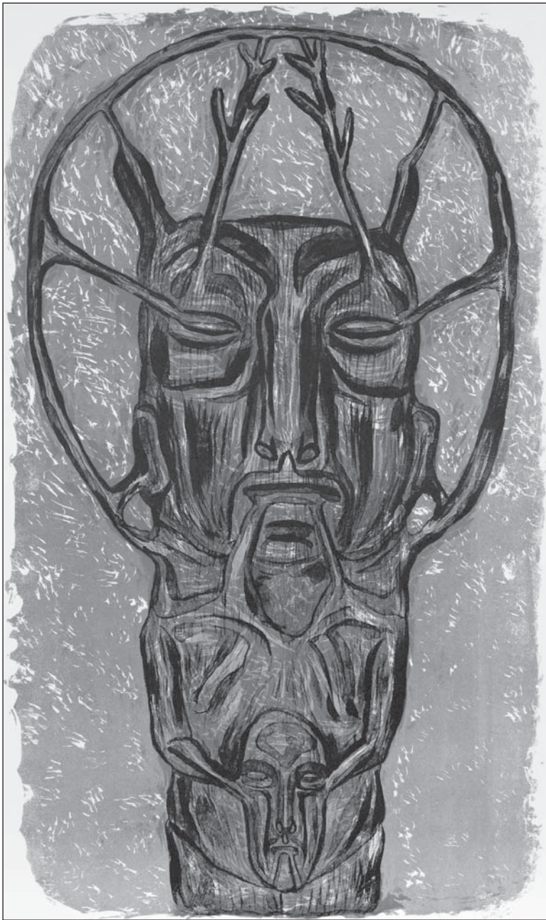
Gaál József: Lapok a „HOMOGRAM” mappából III.